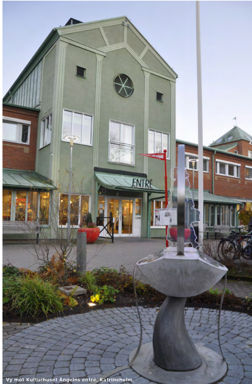
Vy mot Kulturhuset Ängelns entré, Katrineholm.